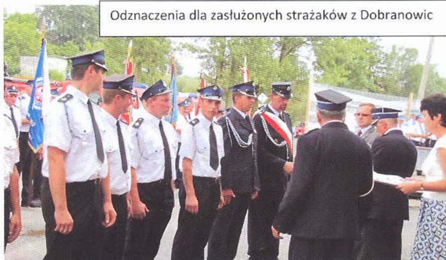
Odnaczenia dla zasłużonych strażaków z Dobranowic