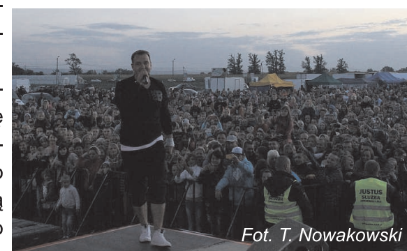
Fot. T. Nowakowski