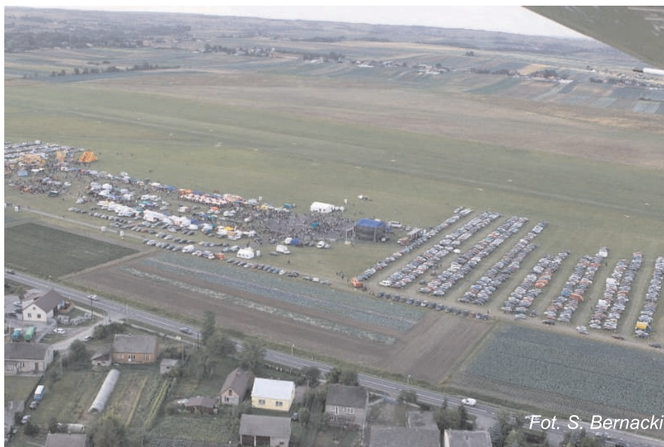
1 września 2013r. VI Małopolskie Święto Warzyw w Pobiedniku Wielkim Zdjęcie z lotu ptaka

Wójt Gminy Igołomia – Wawrzeńczyce informuje, że od dnia 9 września 2013 do dnia 1 października 2013 będzie wywieszony na tablicy ogłoszeń oraz stronie internetowej Urzędu wykaz nieruchomości przeznaczonych do oddania w najem oraz dzierżawę.