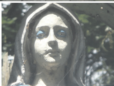
Figura Matki Bożej przed renowacją