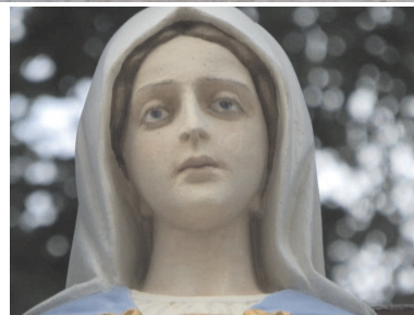
Figura Matki Bożej po renowacji

W wyniku zapytań ofertowych został wyłoniony wykonawca wyżej wymienionego zadania – Pracownia Konserwatorska MARKON z Krakowa. Kwota całkowita zadania wyniosła 34 967,61 zł. Zakończenie całego zakresu robót nastąpiło 29 lipca 2013 r. Stowarzyszenie na wyżej wymienione zadanie otrzyma pomoc finansową w wysokości 70% poniesionych kosztów kwalifikowanych operacji, która będzie wynosiła 24 477,32 zł.