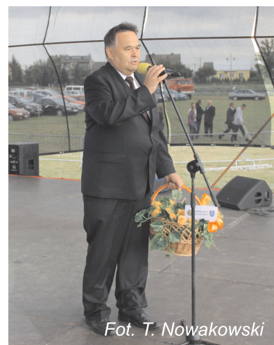
Fot. T. Nowakowski