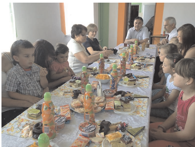
Dzień Dziecka w Żydowie