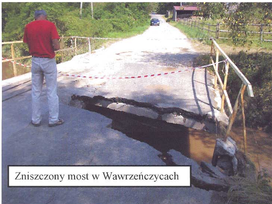
Zniszczony most w Wawrzeńczycach