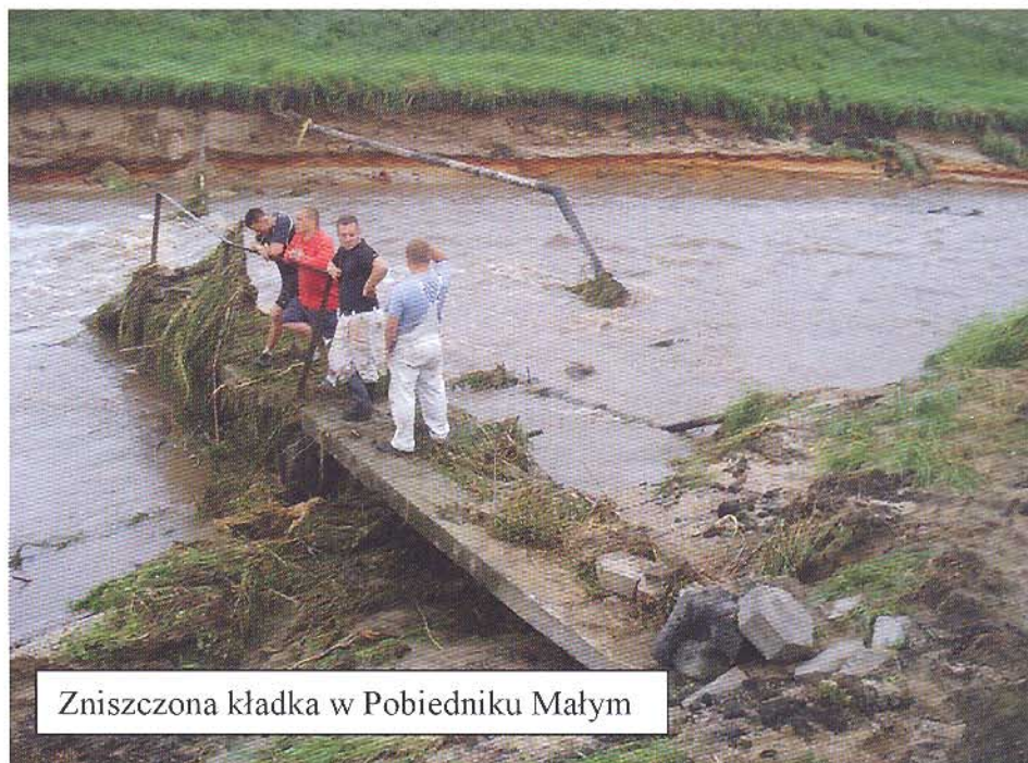
Zniszczona kładka w Pobiedniku Małym

kolejny raz wystąpił do Wojewody Małopolskiego o przyznanie właściwych środków finansowych przeznaczonych na ochronę przeciwpowodziową. Dnia 29.08.2010 do tutaj Urzędu wpłynęło pismo MZM i UW w Krakowie odpowiadające na pismo R6225/08/10 zapewniające, że instytucja ta dokona starań, aby ograniczyć zagrożenie ze strony rzeki Wisły oraz potoków przepływających przez teren gminy. Jednakże zaznaczają, że zakres robót konserwacyjno-modernizacyjnych na realizację zadań w powyższym zakresie uzależniony jest od wysokości środków finansowych jakie otrzymują z budżetu Państwa. Obecnie środki te pokrywają 7 % faktycznych potrzeb województwa w zakresie utrzymania i konserwacji melioracji wodnych. Dnia 06.08.10 Wójt otrzymał do wiadomości pismo Zarządu Województwa Małopolskiego kierowane do Wojewody Małopolskiego o przyznanie środków finansowych przeznaczonych na usuwanie skutków powodzi.