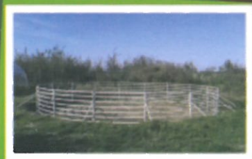
Baseny oczyszczające wodę