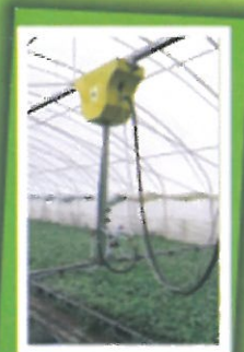
Ramiona zraszające do produkcji pod osłonami